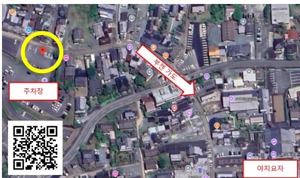
▲ 부젠 가도 https://maps.app.goo.gl/69XXVbPHHEFvEBhd9