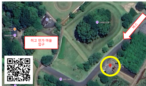
▲ 히고 민가 마을 https://maps.app.goo.gl/bK56NylQRv9tHwB6

【승하차 장소】 ※자세한 내용은 QR 코드 또는 URL을 통해 확인해 주시기 바랍니다.