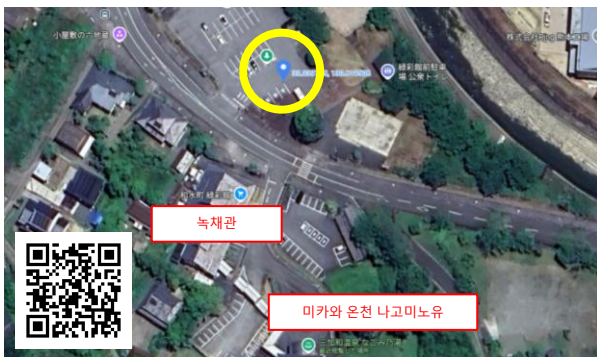
▲ 미카와 온천 나고미노유 https://maps.app.goo.gl/eJ5Tbk7RrrWstHc7