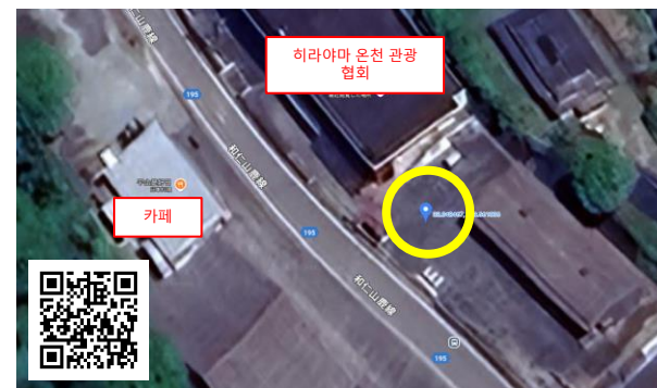
▲ 히라야마 온천 관광 협회 https://maps.app.goo.gl/JdxqBGA8zNDTyNXw5