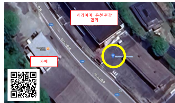
▲ 히라야마 온천 관광 협회 https://maps.app.goo.gl/JdxqBGA8zNDTyNXw5